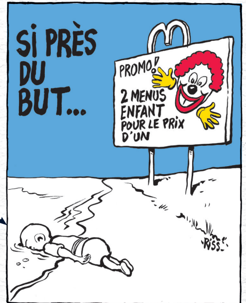
Riss, Charlie Hebdo , 9 septembre 2015